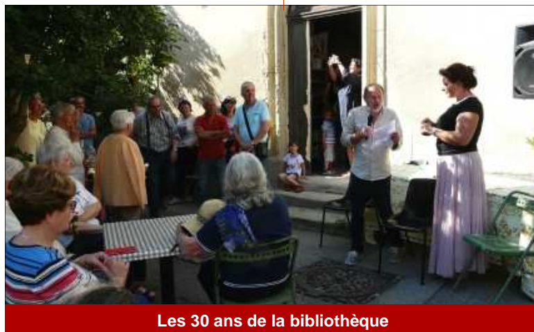
Les 30 ans de la bibliothèque

La sympathique fête organisée pour les 30 ans de la bibliothèque a rencontré un grand succès, grâce à la mobilisation des énergies des bénévoles. Elle devrait rester dans les mémoires comme un bon moment de convivialité.